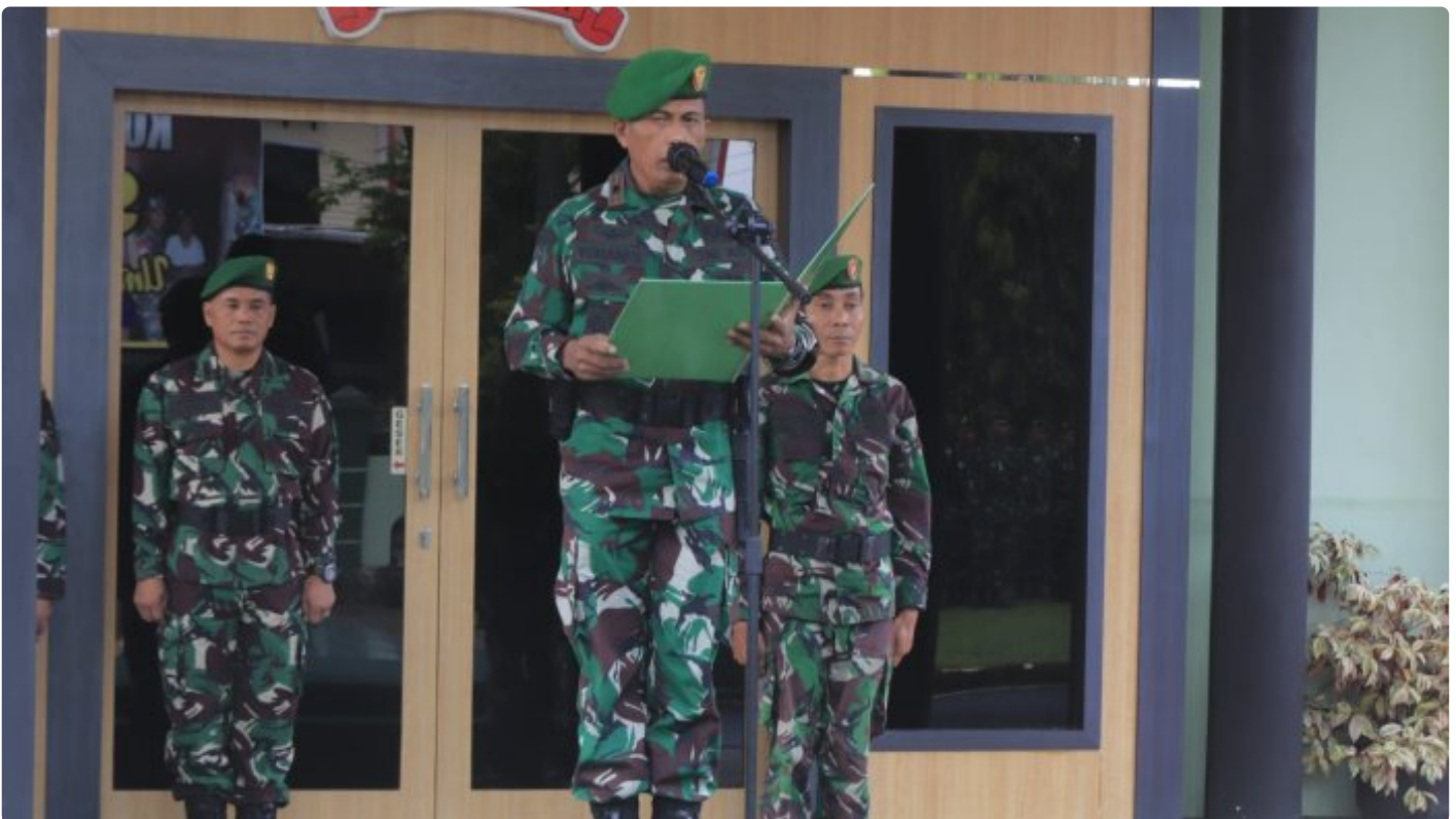
Makna Upacara Bendera Merah Putih Dibulan Suci Ramadhan Bagi Prajurit Kodim 1006/Banjar

MARTAPURA - Bagi Prajurit TNI AD Upacara Pengibaran Bendera Merah merupakan suatu keharusan dilaksanakan.